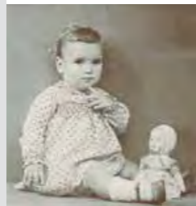
Lone fotograferet på Spædbørnshjemmet Solbo, før hun kom i pleje hos en præstefamilie.